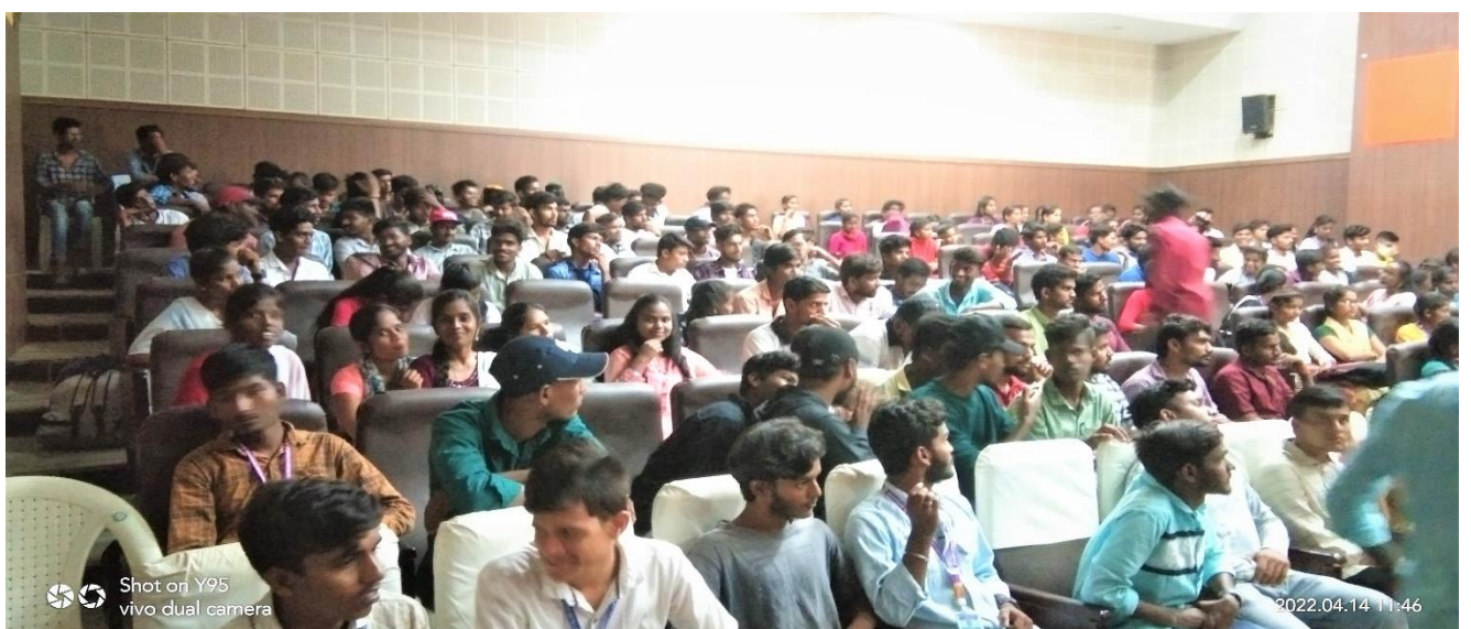
Volunteers gathered in the Auditorium