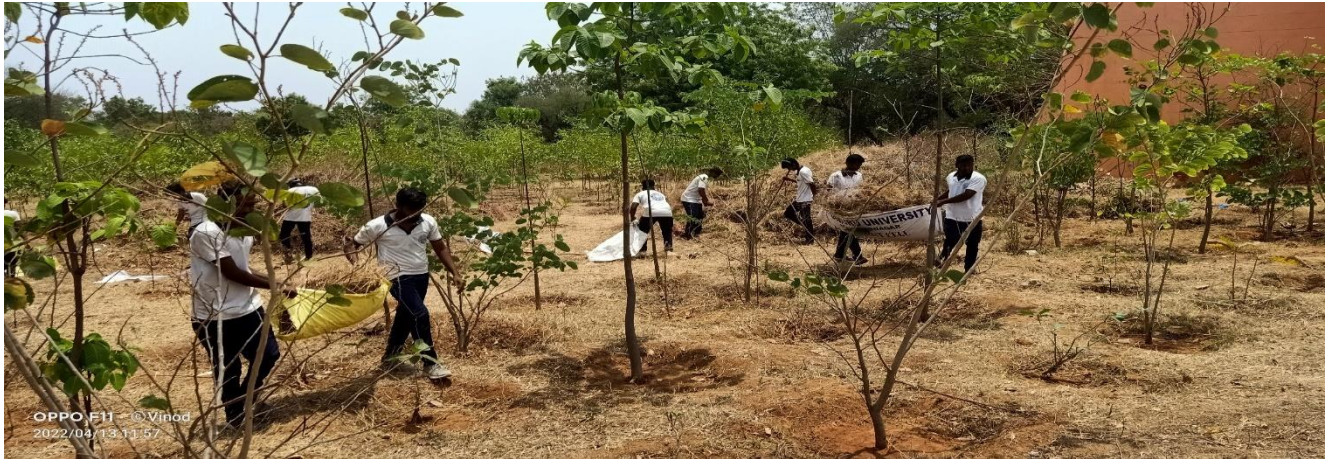
Male volunteers worked for lifting shrubs and mad plants to tractors