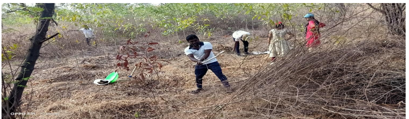
Volunteers removing dry mad plants in field work