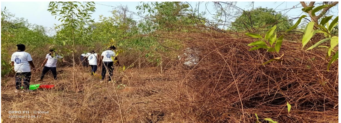
Volunteers removing shrubs, bad plants in front of the Academic Building