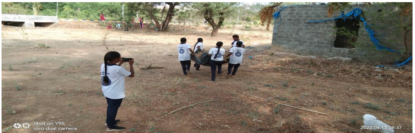
Female volunteers worked for cleaning the Area in between Administrative building and Academic building.