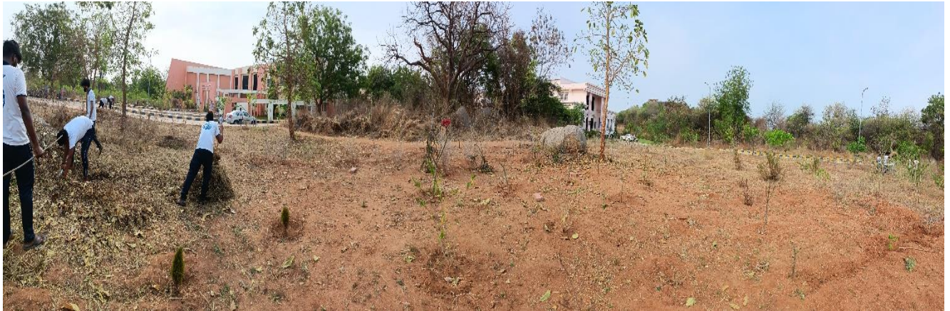
After Field Work at Medicinal Garden