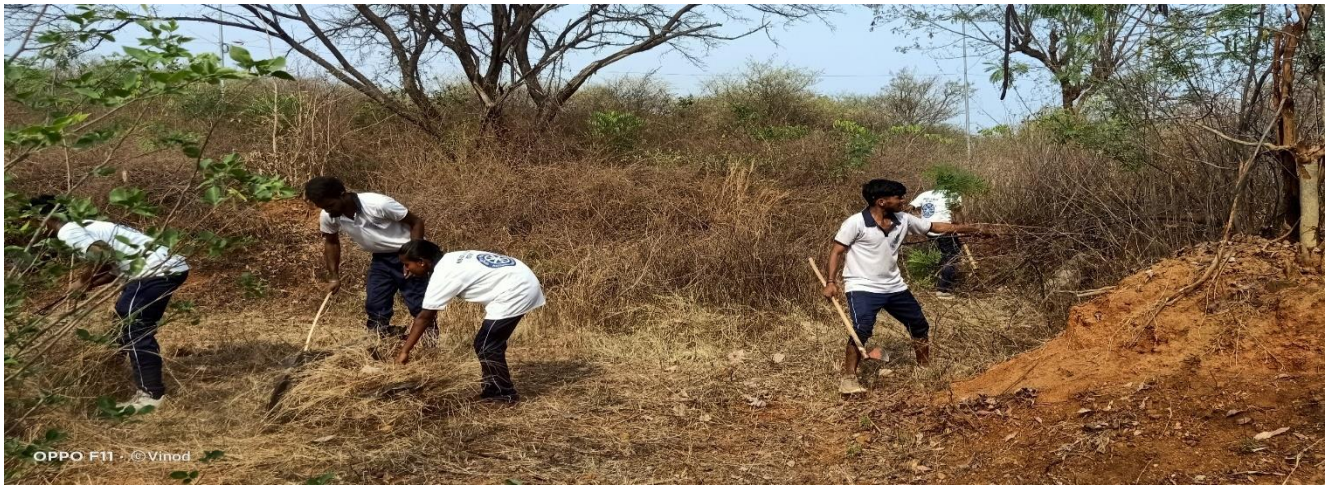
Clearing mad plants and shrubs in front of the Academic Building