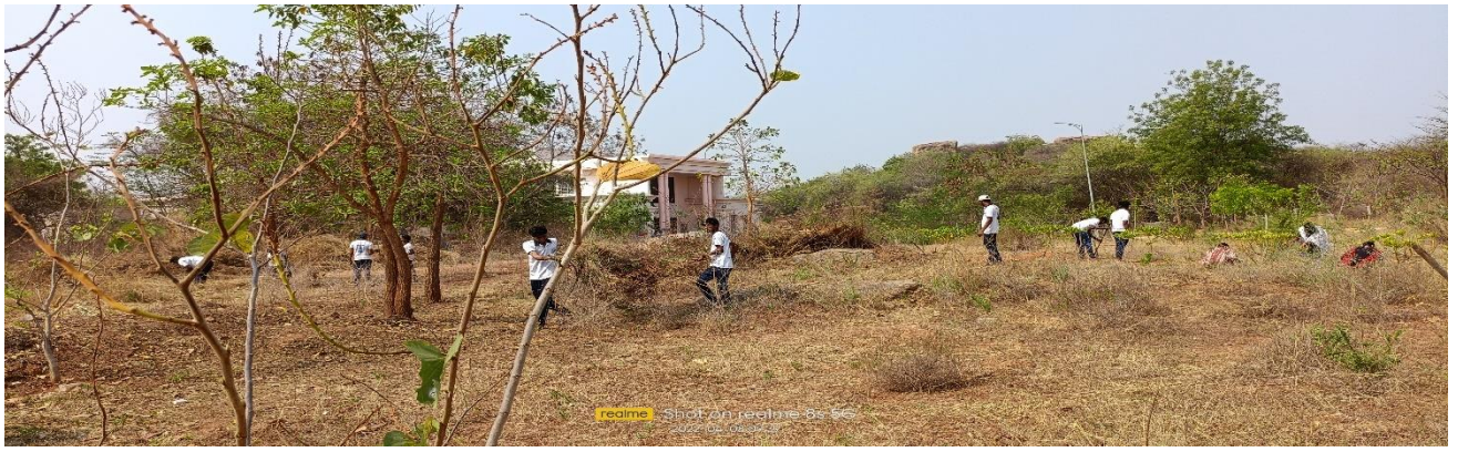
Field Work at Medicinal Garden