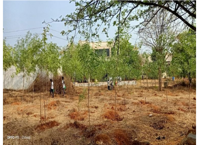
After Field Work by Volunteers