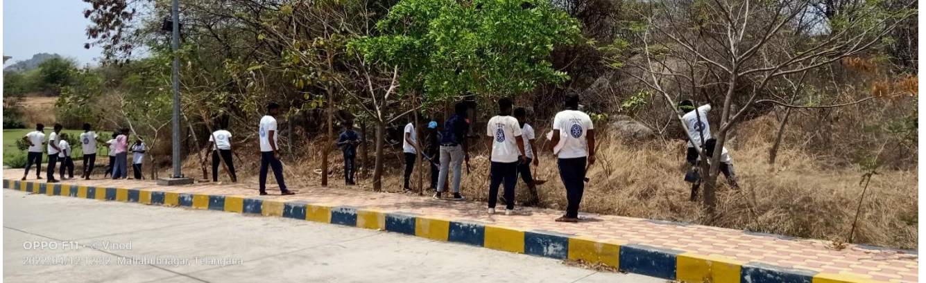
Volunteers removing dry mad plants beside road towards library in the campus