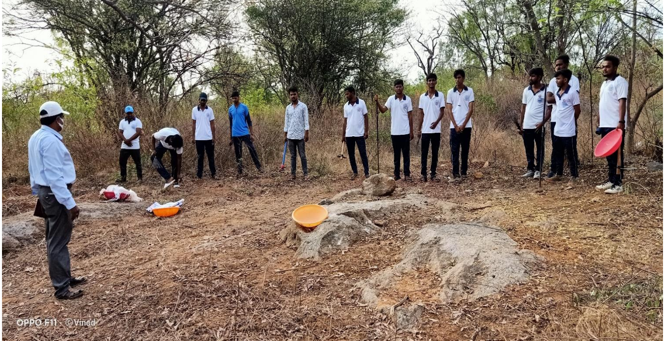
Instructions by Programme Officer to Volunteers on proper care while in the field work

Day – 3 has Started with Field Work by NSS Volunteers of Unit – 5 in university college campus. As per the instructions of the NSS Coordinator, Unit – 5 Volunteers in the area of Academic Building Front Area to clear bushes, shrubs, mad plants and watering the plants. All the male volunteers worked for clearing shrubs and mad plants and female volunteers worked for watering the plants.