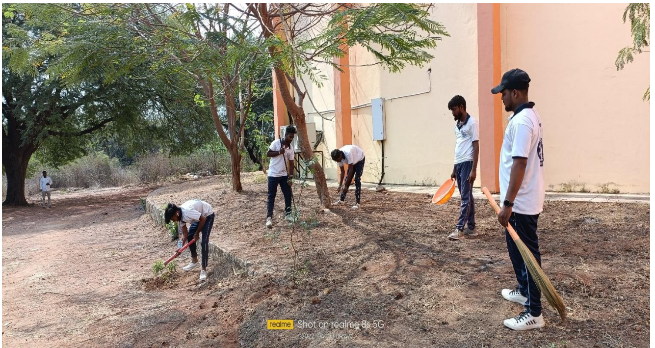
Field Work beside Pharmaceutical Building