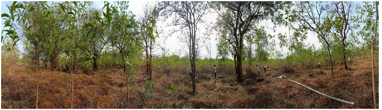
After field work in front of Academic Building