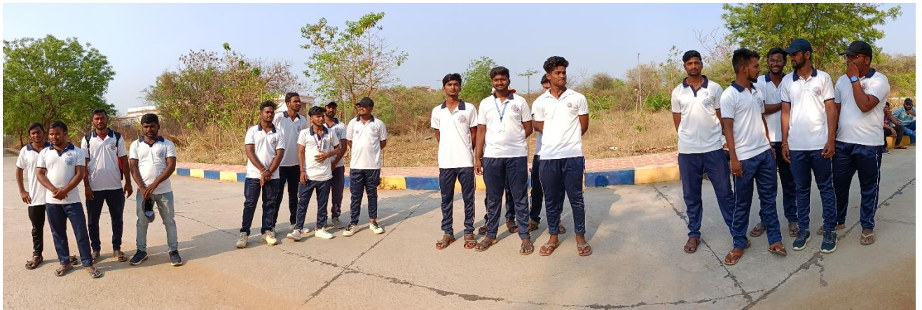
Teams of Unit – 5 for field work