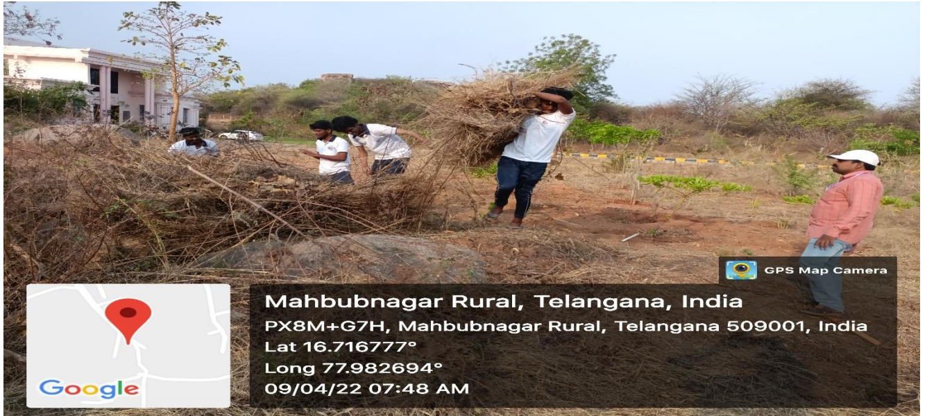
Field Work at Medicinal Garden

Day – 2 has started with Field Work by NSS Volunteers of Unit – 5 in university college campus. As per the instructions of the NSS Coordinator, Unit – 5 Volunteers attached to Medicinal Garden to remove mad plants and watering to medicinal plants for clear visibility. Volunteers divided into teams and allotted areas for field work to be done.