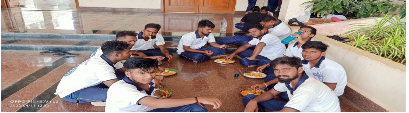
Volunteers lunch time