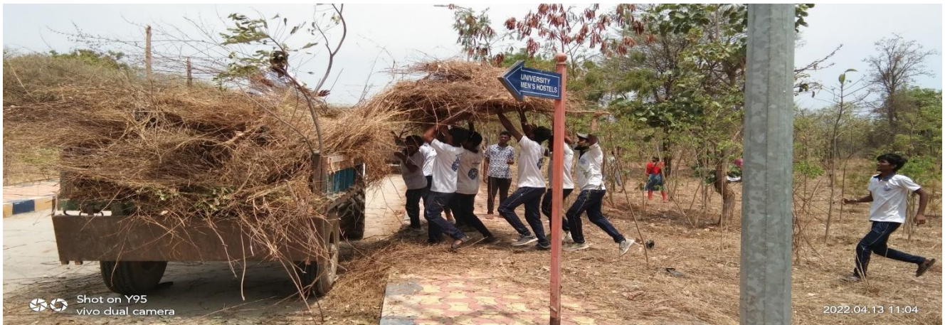
Male volunteers worked for lifting shrubs and mad plants to the tractors