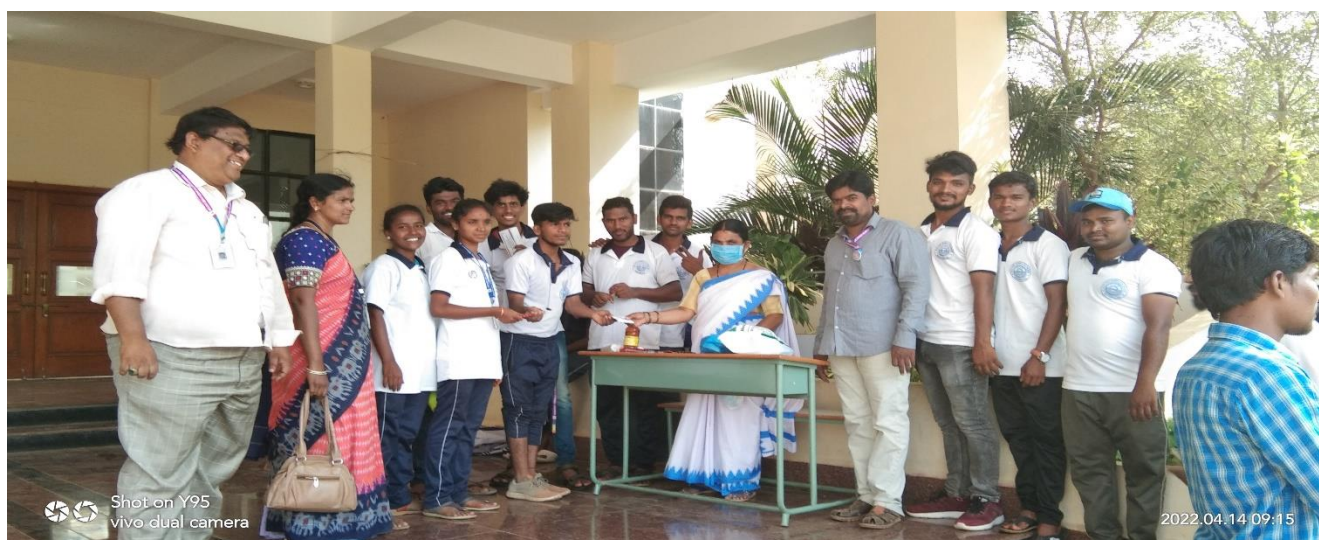
Medical Assistance from DMHO Staff in the camp