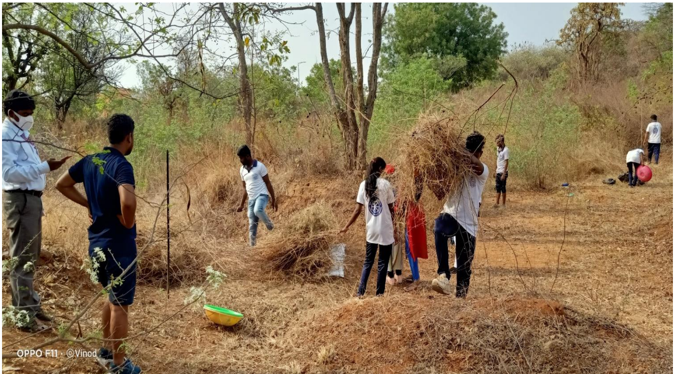
Lifting mad plants in front of Academic Building