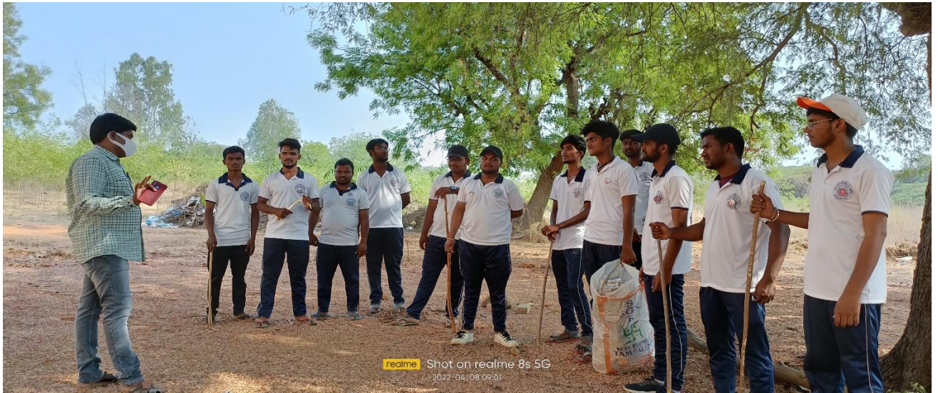
Instructions by Programme Officer R. Nagaraja Chary to Volunteers about Field Work