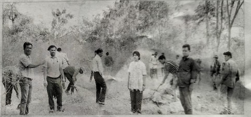
పీయాలో పరిసరాలను శుభ్రం చేస్తున్న ఎన్ఎస్ఎస్ వలంటీర్లు