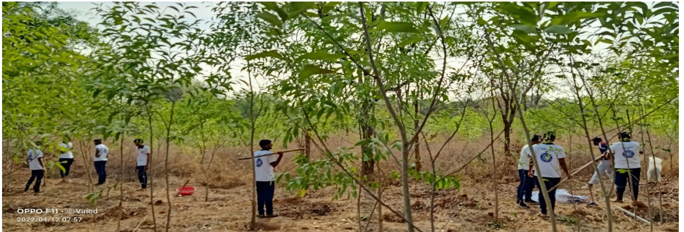
Volunteers moving to remove shrubs, bad plants in front of the Academic Building

Day – 5 has started with Field Work by NSS Volunteers of Unit – 5 in university college campus. NSS Coordinator Dr.K.Praveena has visited and instructed to Unit – 5 Volunteers in the area of Academic Building Front Area and remove dry mad plants beside road towards library and main road in the campus to clear bushes, shrubs, mad plants and watering the plants. All the male volunteers worked for clearing shrubs and mad plants and female volunteers worked for watering the plants. Palamuru University Vice-chancellor Prof. L.B.Laxmikanth Rathod, Registrar Prof. Pindi Pavan Kumar, NSS Coordinator Dr.K.Praveena, MVS College Vice-Principals Dr.G.Satyanarayana Goud & Sri.B.Eswaraiah and staff members of mvs college Visited to the Special Camp