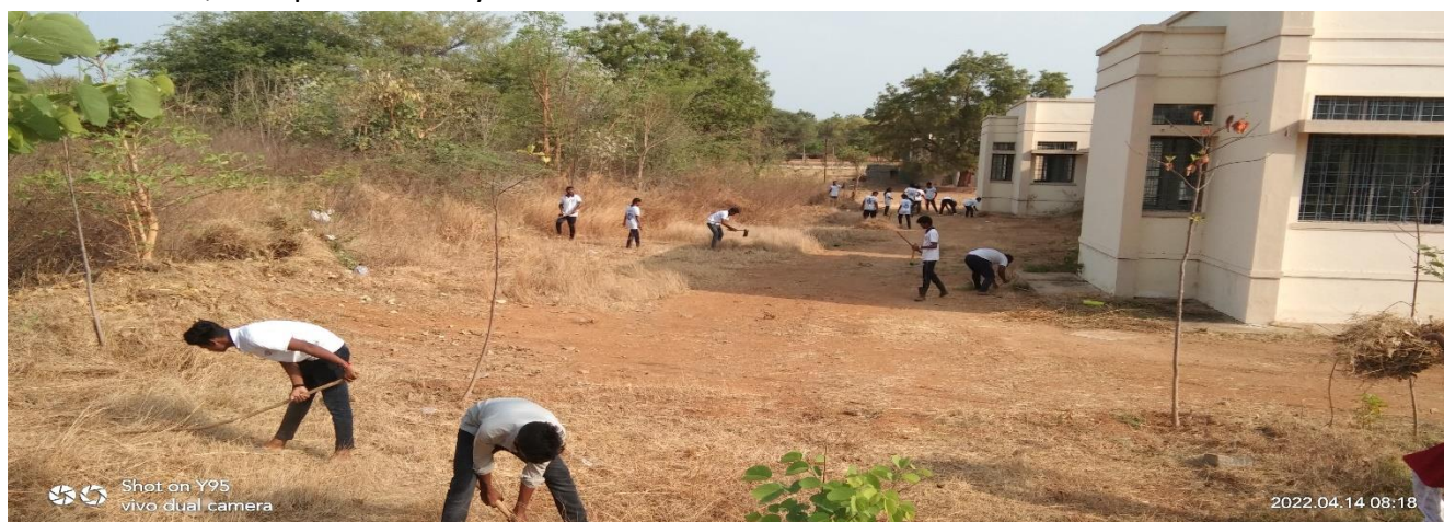
Volunteers removed waste grass and making tree trunks beside of the Academic Building