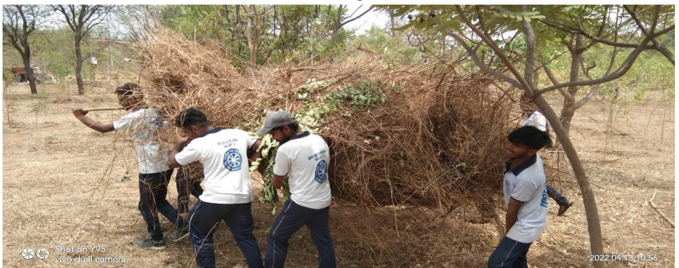
Male volunteers worked for lifting shrubs and mad plants to the tractors